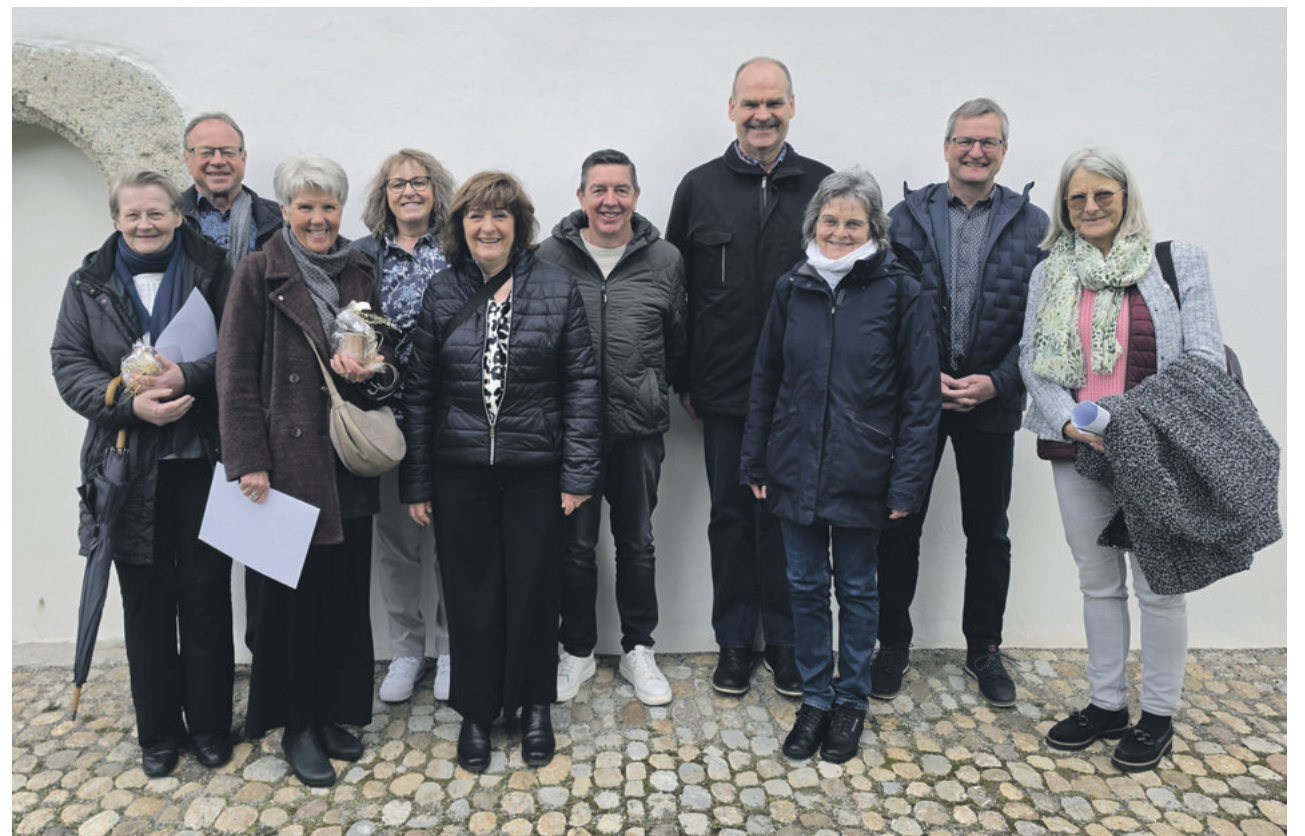
Die Goldenen Konfirmanden und Konfirmandinnen 2025